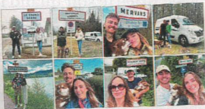
TOUR DE FRANCE DES DÉSERTS MÉDICAUX 2024